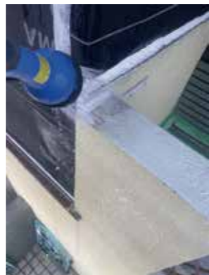
防水ジョイント部分