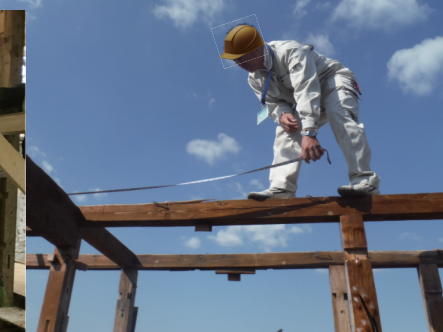
※S基準とは、新築の長期優良住宅と同程度の水準をもつ住宅のことをいいます。