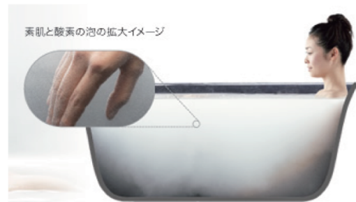
※モイスター効果とは、湿気、しめりけ、水分という意味。化粧品などで肌に潤いを与え、しっとり感を保つたらきを「モイスター効果」という。