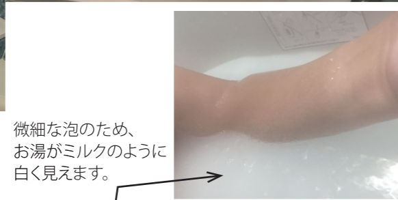
微細な泡のため、お湯がミルクのように白く見えます。