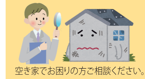
空き家でお困りの方ご相談ください。