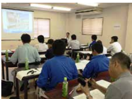
やっぱり私どもの団体(求められる工務店会)は真面目(*^。^*)太鼓判

その他の個別相談並びに耐震診断を、門真市・枚方市・大阪市・寝屋川市・守口市・豊中市・茨木市・高槻市などで行いました。