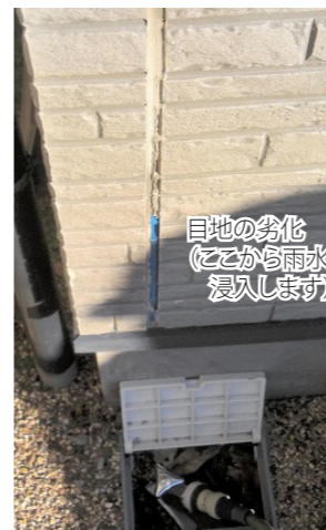
目地の劣化 (ここから雨水が浸入します)

特に住まいの劣化部分(家がケガをしている部分)を発見していきます。例えば屋根の雨漏り検査であったり、外壁からの雨水進入が無いかを調べ住まい全体をトータルで診断していきます。